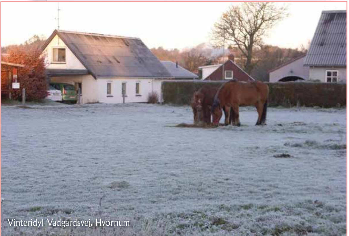
Vinteridyl Vadgårdsvej, Hvorum