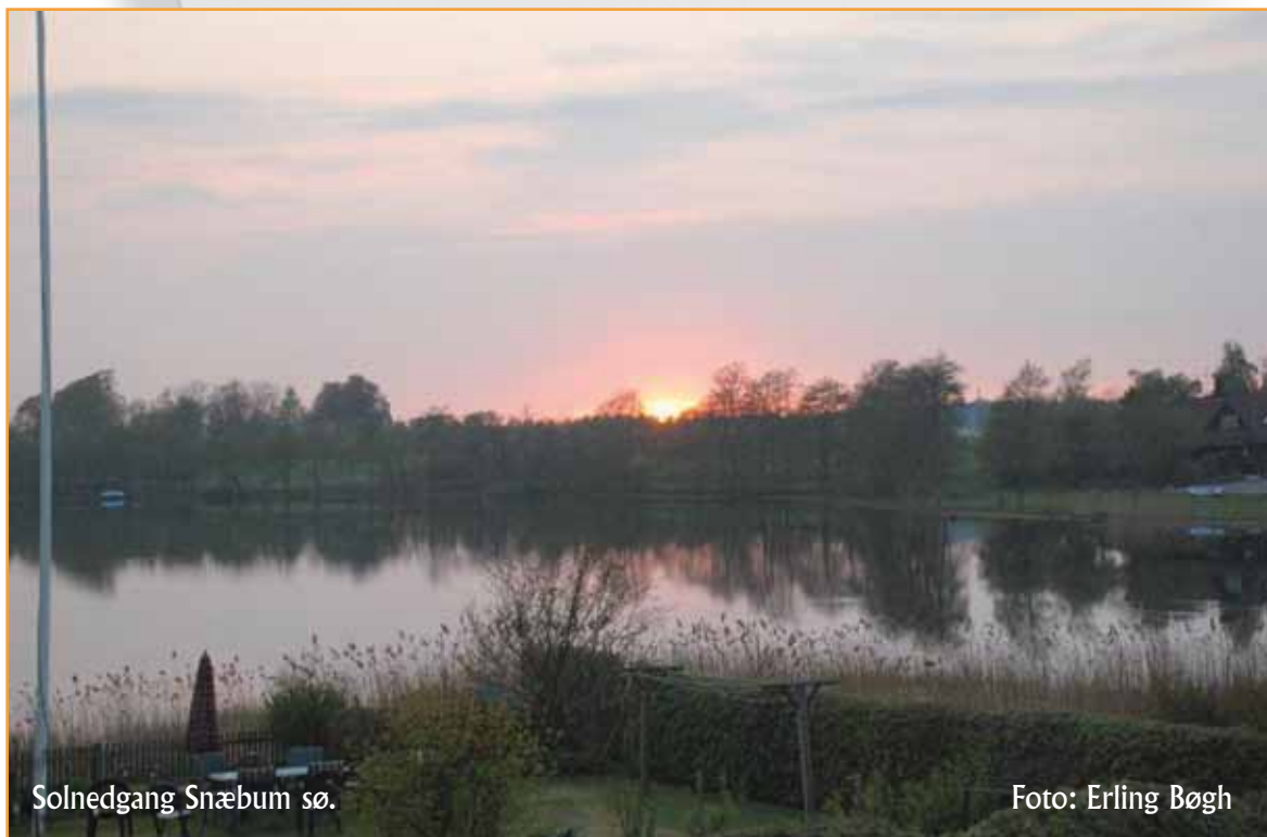
Solnedgang Snæbum sø.