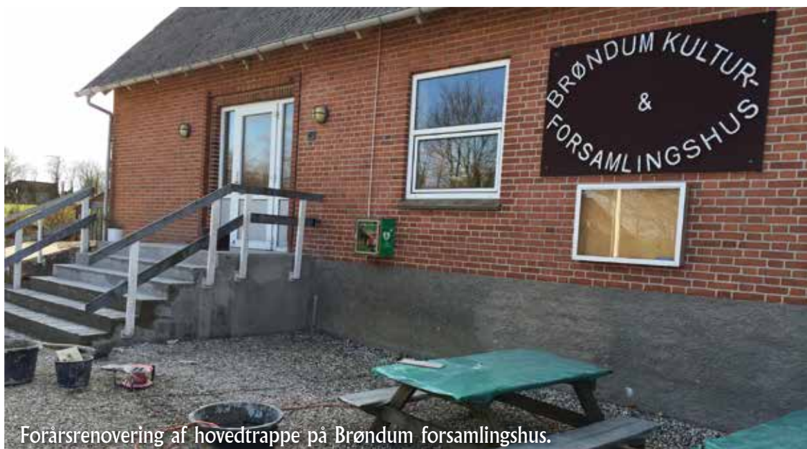
Forårsrenovering af hovedtrappe på Brøndum forsamlingshus.